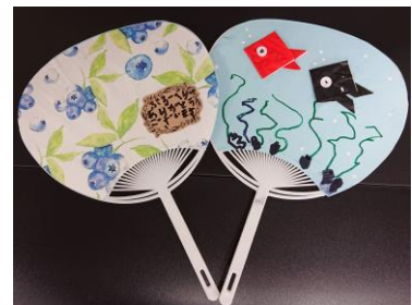
のぞみこども園児よりお礼