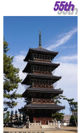
総本山善通寺五重塔