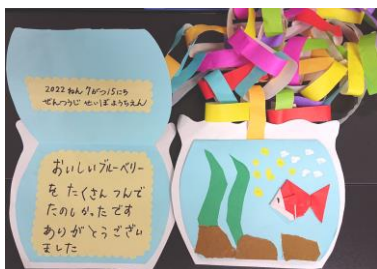
聖母幼稚園児よりお礼