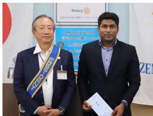
葛石会長より卓話の謝礼