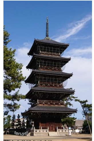
総本山善通寺五重塔