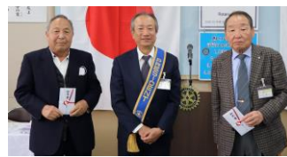
全快されて例会出席のお二人にお見舞いをお渡ししました

●地区大会のご案内 本会議 5/20(土)1日のみ なお、前日に記念ゴルフ大会およびRI 会長代理晩餐会が行なわれます。