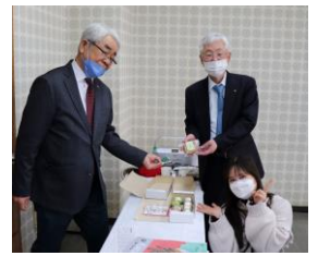
タオさんよりお礼の差し入れを頂きました