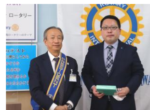
会長よりお礼の記念品を