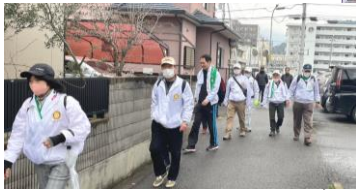
甲山寺への遍路道