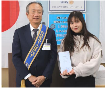
米山奨学生タオさんに3月分の奨学金を会長より渡しました。