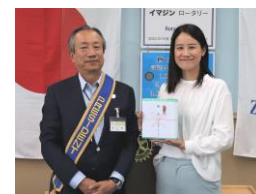
会長より記念品を ※頂きました原稿より編集しました