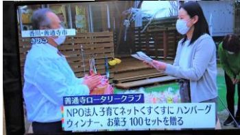
12/24 地区補助金事業でもあるひとり親家庭へのフード支援事業を実施。西日本放送 TV に 12/25 に放送された