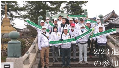
2/23 遍路道ウォークの参加