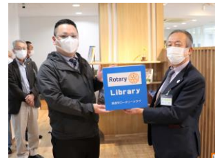
ZEN キューブに図書寄贈 Rotary Library 贈呈