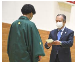
1/7 はたちの集いにて 3年ぶりに20歳への手紙を返還