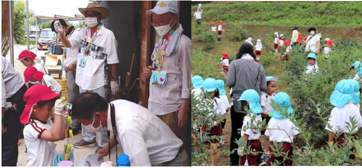
7/15 プルーベリー工房「パティーナ」にてのぞみ児童園と聖母幼稚園児の「ブルーベリー摘み取り体験」事業を実施