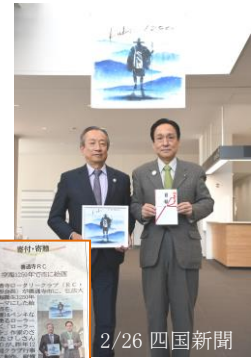
2/26 四国新聞 ←掲載記事