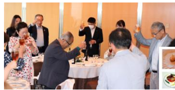
5/28 結婚祝食事会 12組参加 JRホテルクレメント高松フィオーレ