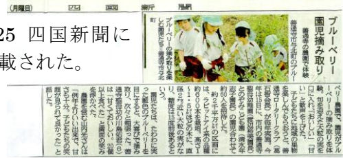
7/25 四国新聞に掲載された。