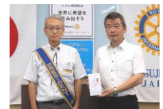
会長より講話の記念品を