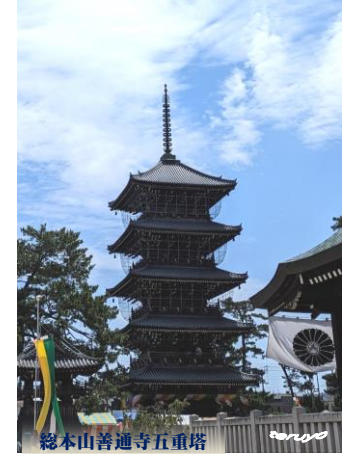
総本山善通寺五重塔