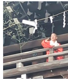
2024.2.25 撮影 総本山善通寺大会陽 新・はだかまつり