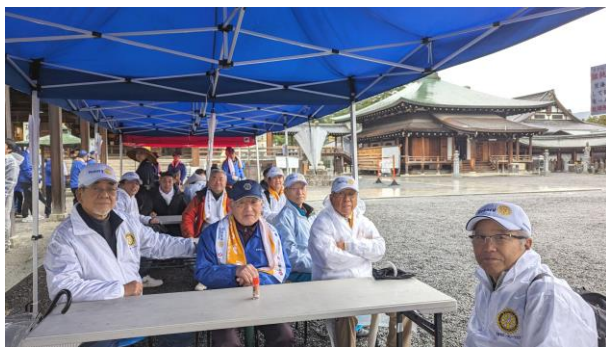
総本山善通寺で ←お接待