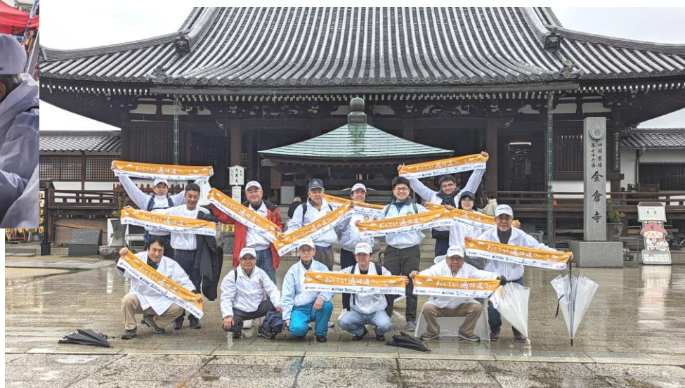
一日一斉おもてなし遍路道ウォーク 第76番札所 金倉寺に到着でパチリ