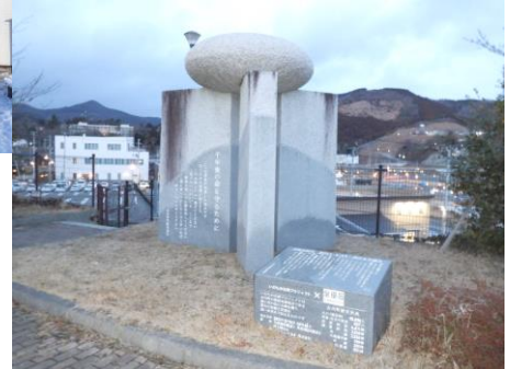
女川 命の石碑プロジェクト