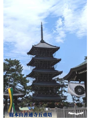
総本山善通寺五重塔