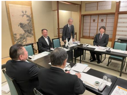
石巻南 RC の例会に出席