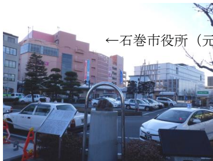
←石巻市役所（元百貨店）