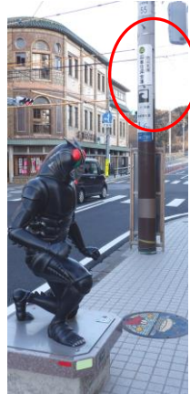
上→津波避難標識 左→津波到達表示板

次に、今回、石巻を訪問して受けた印象と夜間例会での石巻南RC会員との懇談の中でお聞きした石巻の現在の課題について簡単にお話しします。