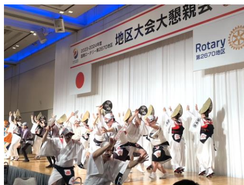
地区大会懇親会でのアトラクション

ロータリークラブのあらましや会員としての体験談などを聞くことで、ロータリーのビジョンや理念について敬意をもつとともに、大いに共感できる部分もあり私自身も色々考えることができました。また、会員になったばかりの私にとって少しずつでも親睦を深めていくことができた有意義な時間でした。皆様、ありがとうございました。