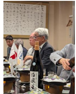
石巻南RCより頂いた銘酒2本を皆でご賞味