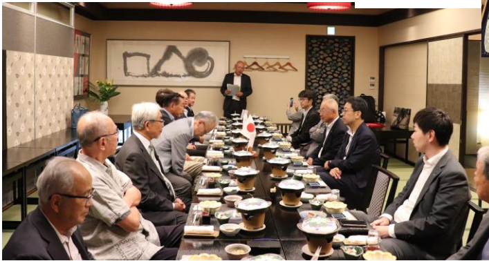
山下親睦委員長司会にて開宴