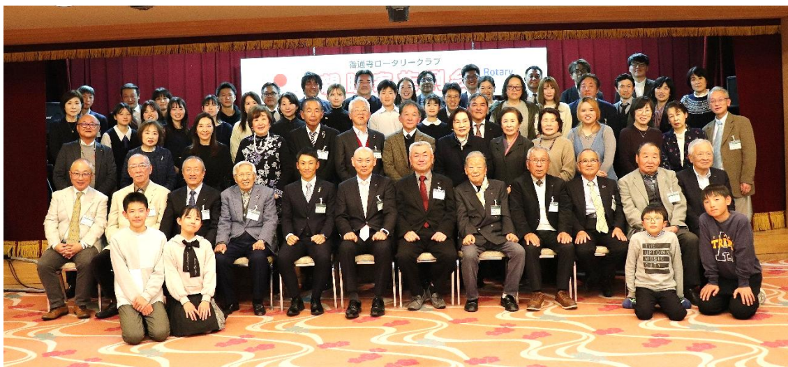
年末家族会 2025.12.13 紅梅亭にて

★ SAAより コーヒーメーカー故障のため、本日のコーヒーサービスは中止します。