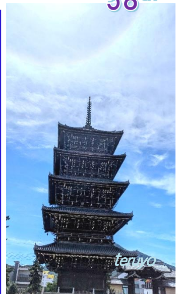
総本山善通寺五重塔