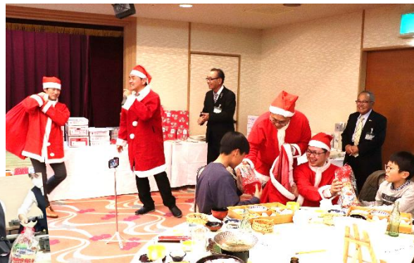
親睦サンタより子供たちにプレゼント