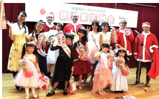
ダンスを披露したアカラキッズたちにもプレゼント