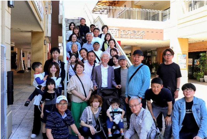
14:15 三井アウトレットパーク お買物を楽しんでもらう前に集合写真を撮る