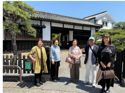
10:15 バス到着 倉敷アイビースクエアホテル前にて