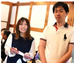
錫婚式祝 松本ご夫婦