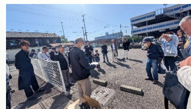
バスで出発前に例会の様子