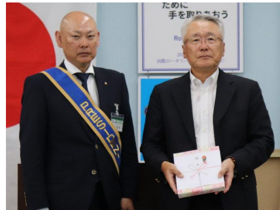
会長より記念品を