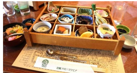
倉敷アイビースクエア レストラン 葛で昼食